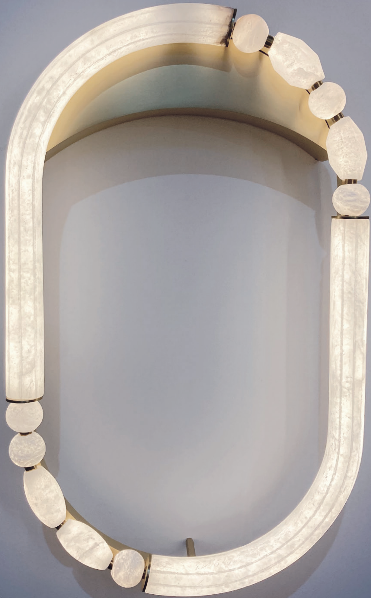
Applique Pearl / Pearl Wall light Albâtre et laiton . Brass and alabaster