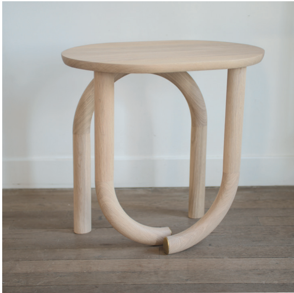
Chevet Pearl / Pearl Bedside table Chêne naturel extra mat et laiton . Natural oak extra mat and brass