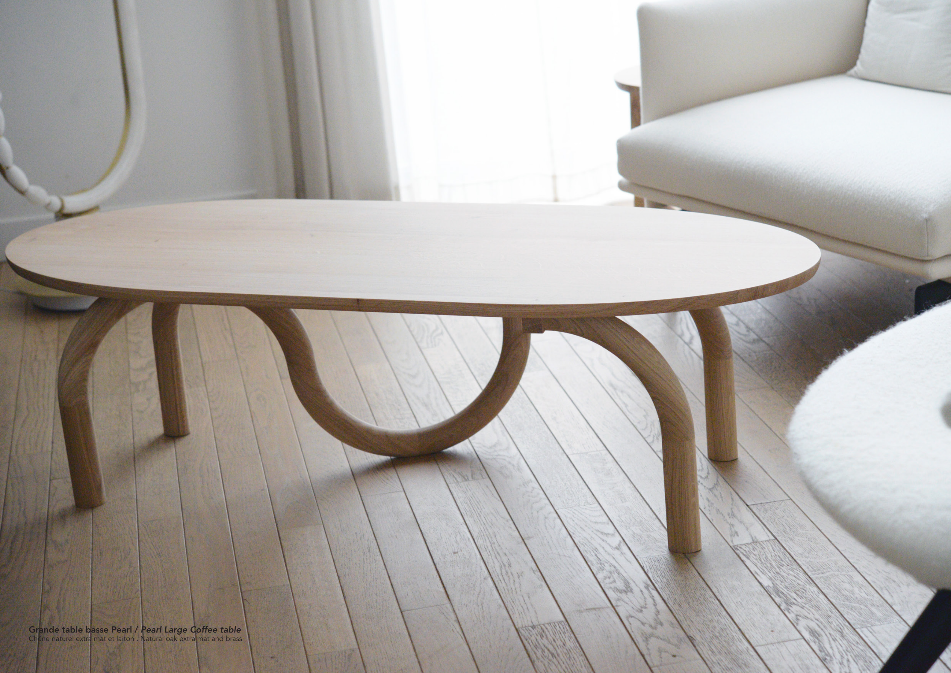
Grande table basse Pearl / Pearl Large Coffee table Chêne naturel extra mat et laiton . Natural oak extra mat and brass