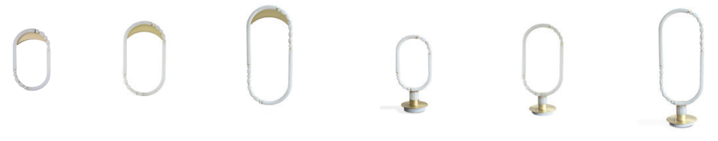
Suspension Canne Canne Pendant