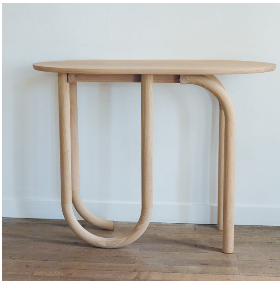
Console Pearl / Pearl Wall table Chêne naturel extra mat et laiton . Natural oak extra mat and brass