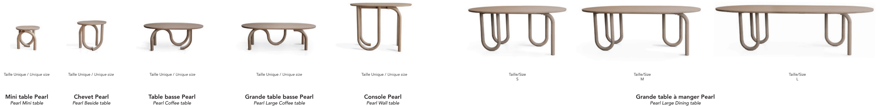
Taille Unique / Unique size Taille Unique / Unique size Taille Unique / Unique size Taille Unique / Unique size Taille Unique / Unique size Taille/Size S Taille/Size M Taille/Size L Mini table Pearl Pearl Mini table Chevet Pearl Pearl Beside table Table basse Pearl Pearl Coffee table Grande table basse Pearl Pearl Large Coffee table Console Pearl Pearl Wall table Grande table à manger Pearl Pearl Large Dining table