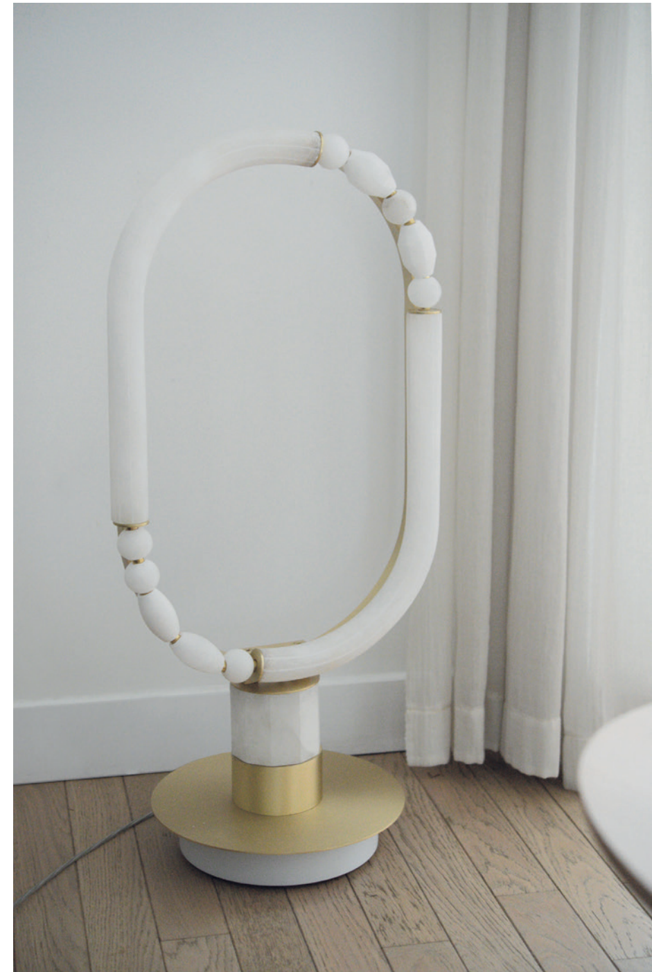
Pearl à poser / Pearl Standing lamp Albâtre et laiton . Brass and alabaster