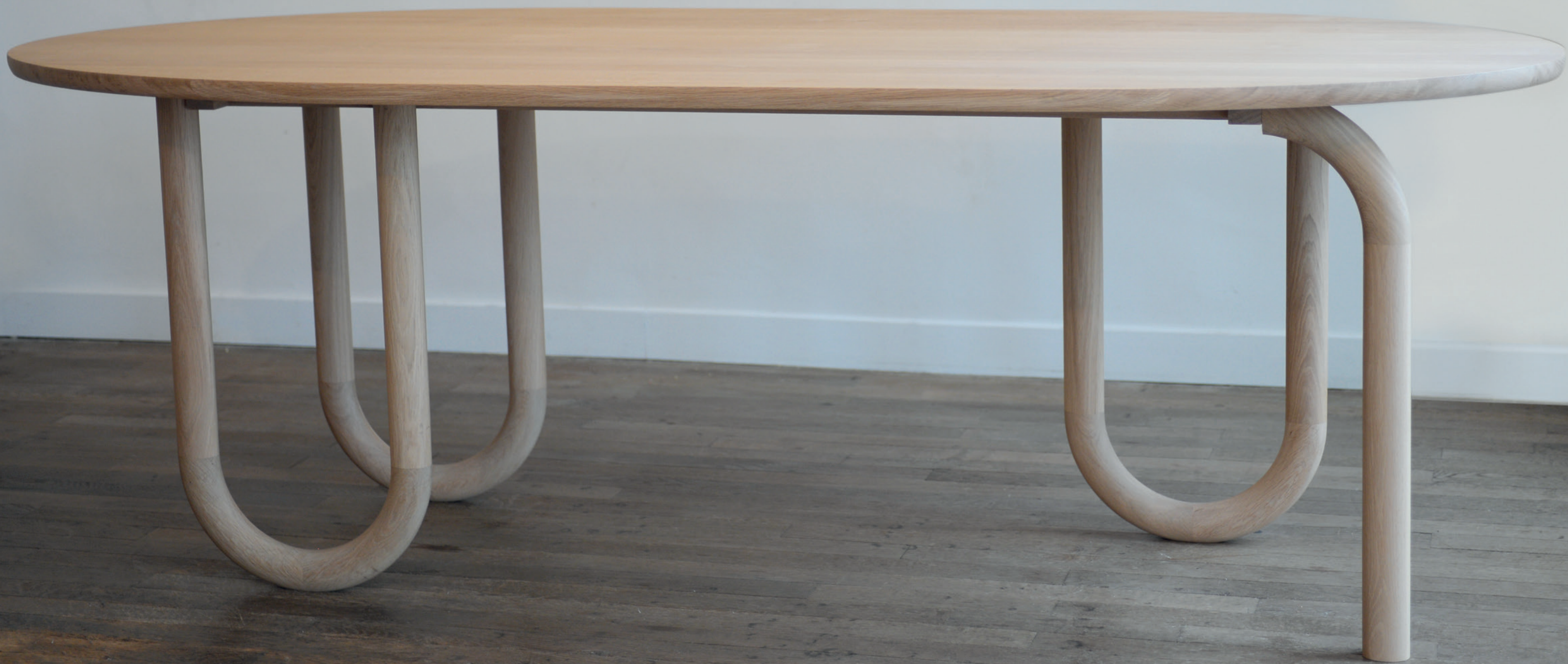
Grande table à manger Pearl / Pearl Dining table Chêne naturel extra mat et laiton . Natural oak extra mat and brass